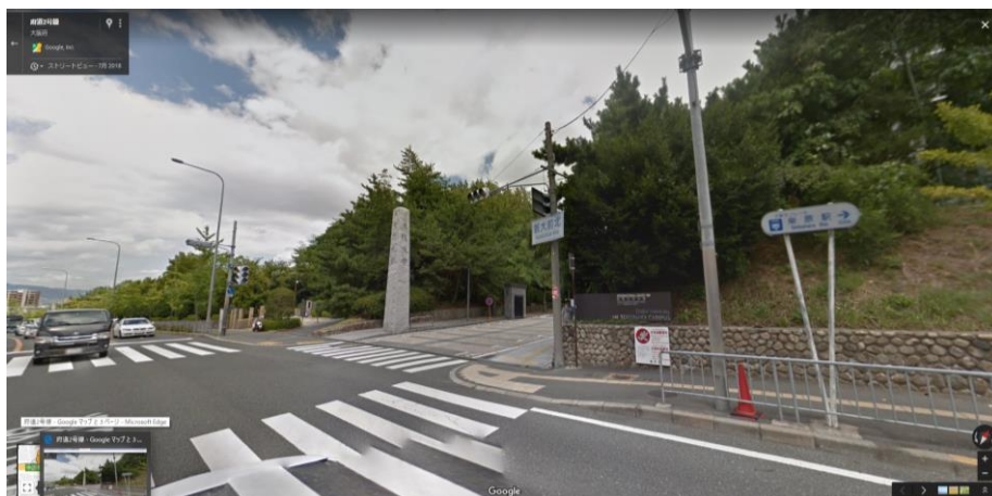
(写真 2: 正門)