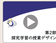
第2部 探究学習の 授業デザイン