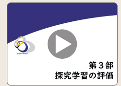
第3部 探究学習の評価