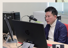
オンライン開催の様子(2020年)